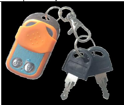
Пульт дистанционного управления + Ключ механический