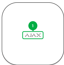
1 - Логотип со световым индикатором.